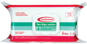
Flow Wipes Sensitive